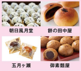
朝日風月堂 餅の田中屋 五月ヶ瀬 御素齋屋 田舎まんじゅう / 白髭さんの焼きまんじゅう カップケーキ【栗・チョコ】 / かりんとう饅頭 (福和会有志の会)