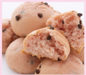
いちごチョコタマゴン (オーカワパン)