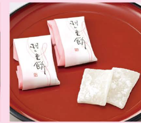
羽二重餅 (村中甘泉堂)