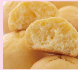
タマゴンボール (オーカワパン)