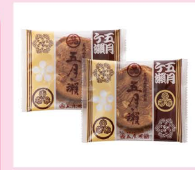
名代石窯焼煎餅 五月ヶ瀬 (五月ヶ瀬)

大名町交差点付近 (マラソン・ベアリレーマラソン) 裁判所前交差点付近 (5km/1.5km)