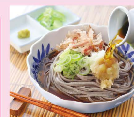
越前そば (武生製麺)