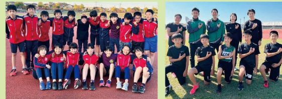
クラブ名 みのり陸上スポーツ少年団 (前半) クラブ名 ユティックT&F Jr (後半)