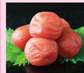
福井梅 (福井県JAグループ)