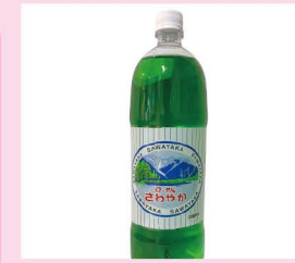
さわやか (北陸ローヤルボトリング協業組合)