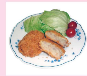
若狭牛コロッケ (公楽商店)