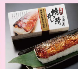
手押し焼き鯖寿司 (越前水産)