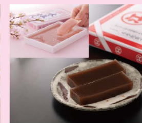
水羊かん・さくら通り水羊かん (えがわ)