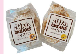
越のリゾット ライスパフ 【ゴマきび糖味】 (円山リゾット米プロジェクト ENZANS)