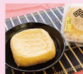
谷口屋の、おあげ (谷口屋)