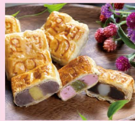
足羽三山 (花えちぜん)