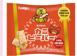
ビーバー 【カニ味・プレーン味】 (北陸製菓)