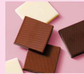
チョコレート (横井チョコレート)