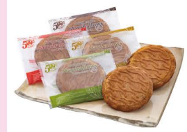
メイシャローズ (五月ヶ瀬)