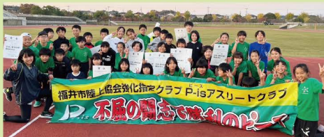
クラブ名 P-is アスリートクラブ