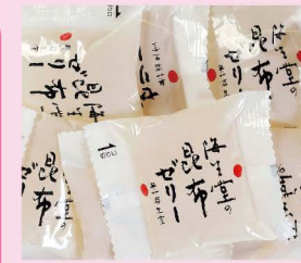
昆布ゼリー (奥井海生堂)