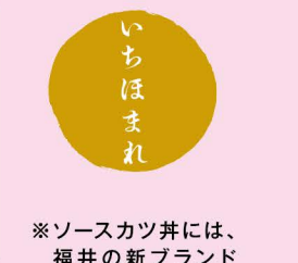
※ソースカツ丼には、 福井の新ブランド 米「いちほまれ」を 使用しています。