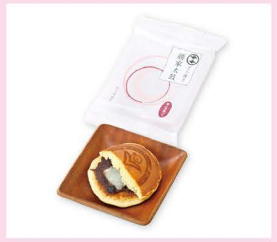
餅どら勝家太鼓 (村中甘泉堂)